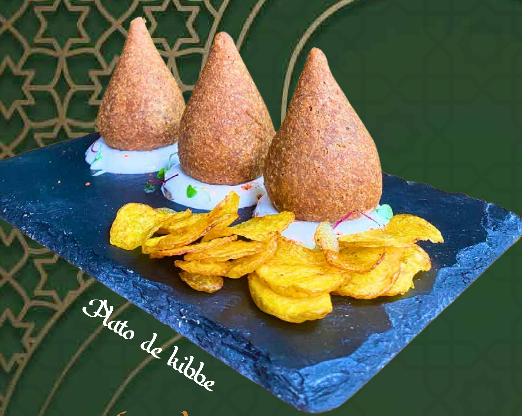
Plato de kibbe