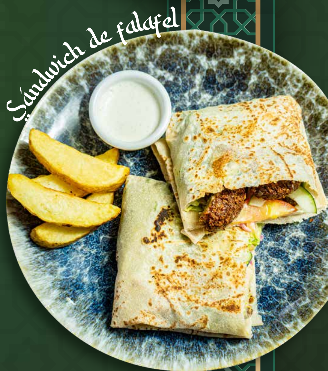
Sándwich de falafel