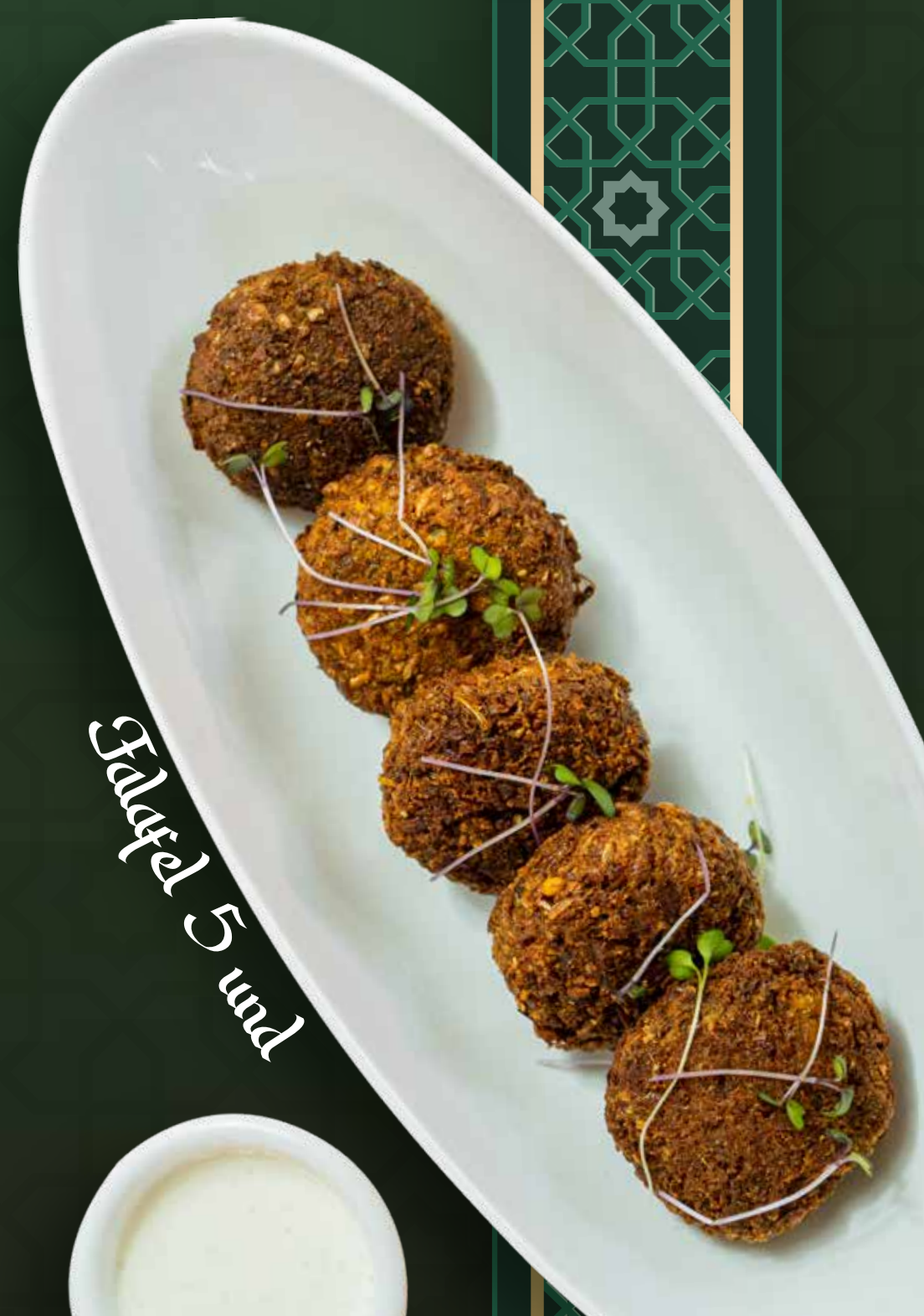
Falafel 5 und