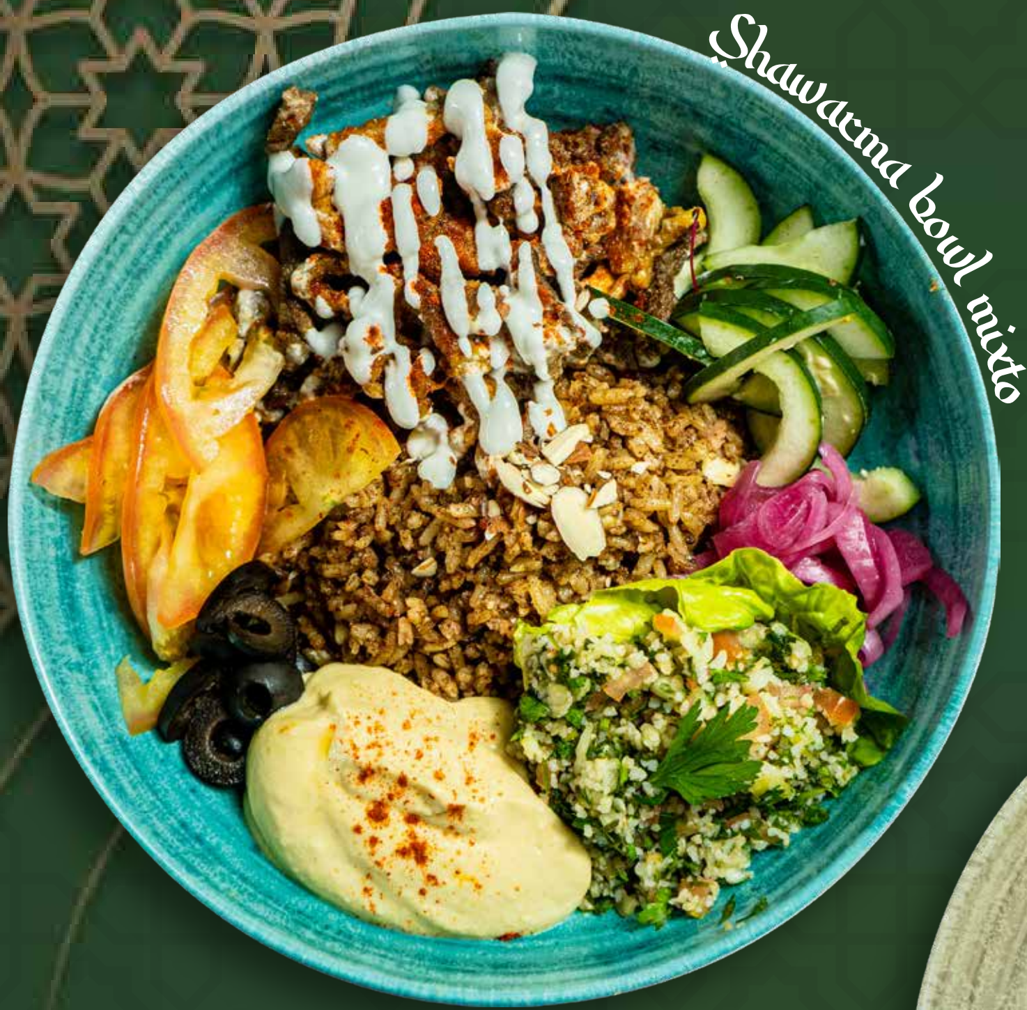
Shawarma bowl mixto